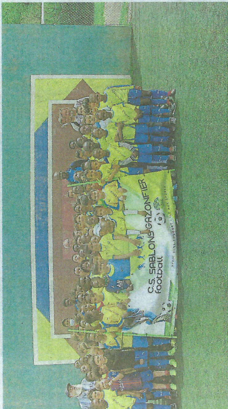
Les enfants du club Sablons-Gazonfier, section foot, se retrouvent tous les mercredis pour l'entraînement.

Samedi, le premier d'une série se déroulera sur le parking de l'île aux sports. « Il n'y a pas de réservation,